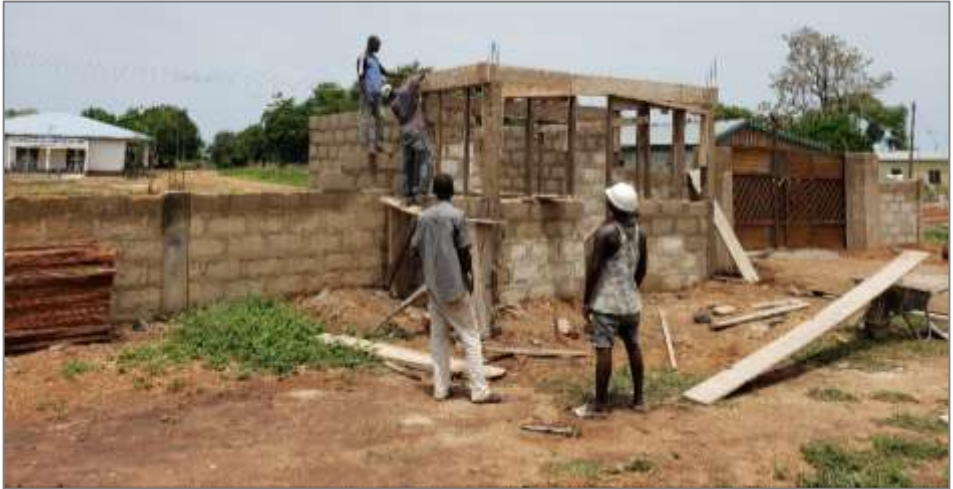
Das Foto zeigt die Errichtung des Kiosk der Frauengemeinschaft, im Hintergrund die Kirche.

Die Corona - Pandemie hat auch wieder deutlich werden lassen, wie dringend eine nachhaltige Lösung der Trinkwasserproblematik ist. Der Ort Yapei ist (noch) nicht an eine öffentliche Wasserversorgung angeschlossen, sondern ist vom Wasser des Weißen Volta abhängig, das die Bevölkerung über große Entfernungen in Kanistern herantransportiert. Alternativ dazu gibt es vereinzelte Brunnen, deren Wasserqualität aber keiner Kontrolle unterliegt. Auf diese Weise ist die Wasserversorgung das Einfallstor für Infektionskrankheiten aller Art. Die Partnerschaftskomitees beider Pfarreien arbeiten an einer nachhaltigen Lösung des Wasserproblems, bei der alle Möglichkeiten erwogen werden und vor allem die Expertise von hiesigen und lokalen Wasserfachleuten hinzugezogen wird.